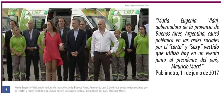
Imagen 1 34