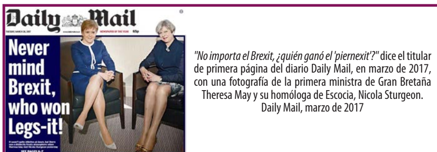
Imagen 2 35