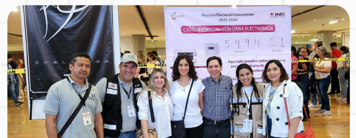
INTEGRANTES DE LA SECRETARIA EJECUTIVA Y COMITÉ DEL FAOE CON INTEGRANTES DE LA CMDH

El ámbito geográfico que abarcan los proyectos es diverso y extendido por todo el territorio nacional como Baja California, Chiapas, Durango, Guerrero, Oaxaca o Tabasco, por mencionar algunos.