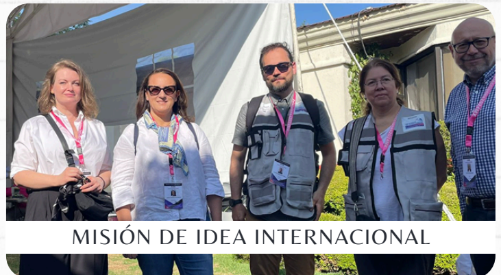
MISIÓN DE IDEA INTERNACIONAL

La misión se reunió con funcionario electoral federal, local y personas expertas que brindaron un balance general del cierre de la elección. Los temas abordados fueron cómputos locales y distritales, digitalización de la elección y violencia política en razón de género.