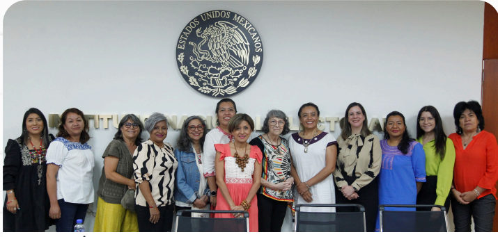
MISIÓN DE EXPERTAS INTERNACIONALES

A esta misión se integró Gladys Acosta, destacada feminista latinoamericana, quien fuera presidenta del Comité para la Eliminación de la Discriminación contra la Mujer del 2021 al 2022.